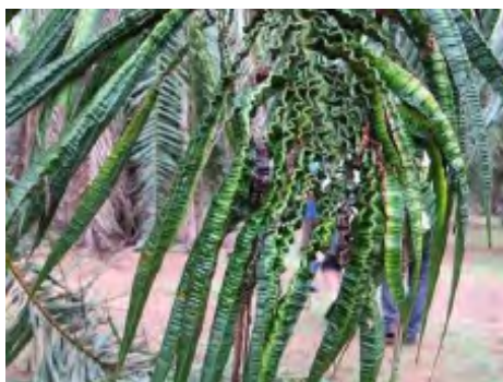
Lá nhàu nát