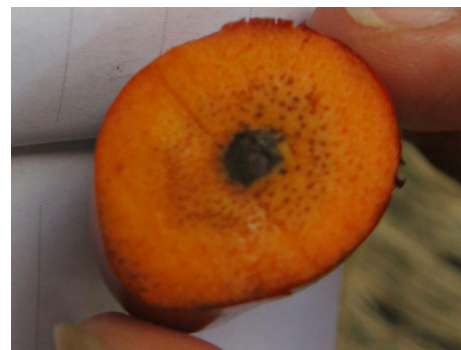
Tạo quả không hạt