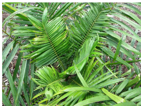
Cọ chưa trưởng thành